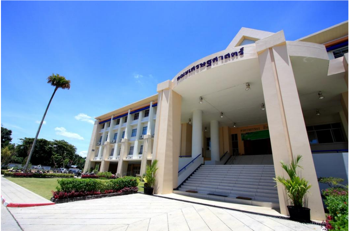
อาคารยรรยง สิทธิชัย (คณะเศรษฐศาสตร์ มหาวิทยาลัยแม่โจ้)

ขอบเขตพื้นที่ภายใต้การดำเนิน Green Office ของคณะเศรษฐศาสตร์ มหาวิทยาลัยแม่โจ้ ขนาดพื้นที่ประมาณ 4,880 ตารางเมตร ประกอบด้วย อาคารสำนักงาน จำนวน 1 หลัง พื้นที่ลานด้านหน้าสำนักงาน พื้นที่ลานพระอนุสาวรีย์พระราชาวงศ์เธอกรมหมื่นพิทยาลงกรณ์ พื้นที่โรงจอดรถด้านหน้าและด้านหลังอาคาร และพื้นที่โดยรอบอาคาร พื้นที่สวน สนามหญ้า พื้นที่มุมพักผ่อน