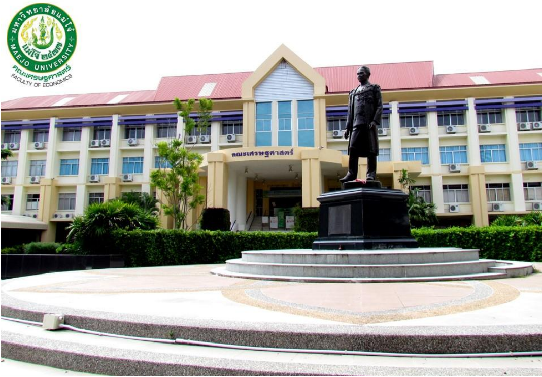
ลานพระอนุสาวรีย์พระราชวงศ์เธอกรมหมื่นพิทยาลงกรณ์